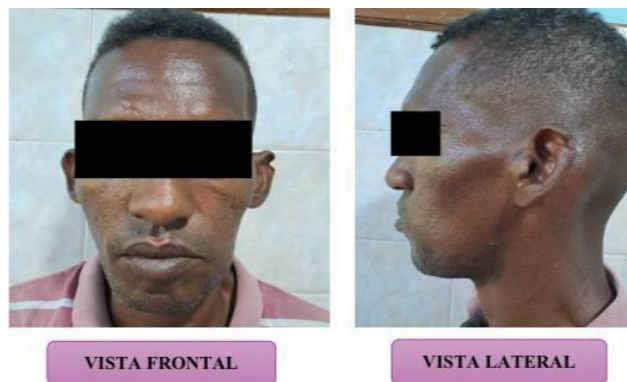
A. Vista frontal

Se observa a nivel extraoral asimetría facial e inflamación a nivel postero inferior izquierdo.